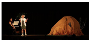
La cabane des animaux