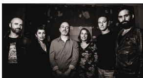
Giro et le chant de la Griffie