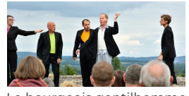
Le bourgeois gentilhomme