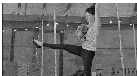
La lune a disparu