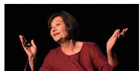
Sorcière (Macha Méril)