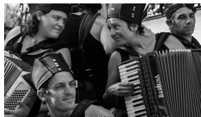
Ca va valser