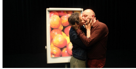
Qu'est ce que le théâtre