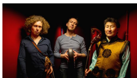
Les violons barbares