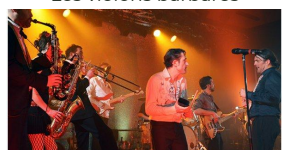
Le bal des variétistes